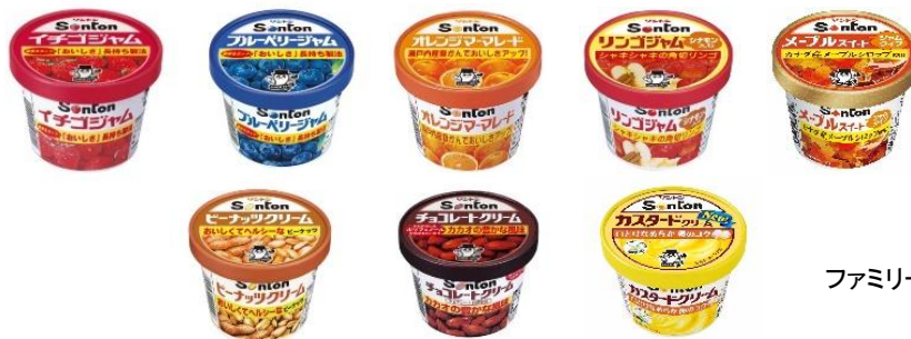
ファミリーカップシリーズ

50年以上続くロングセラー商品「ファミリーカップ」シリーズは、「安全・安心・高品質をリーズナブルに」をコンセプトに、非常に多くの方から支持されているソントンの看板商品です。軽くて丈夫な紙カップなので、子供でも扱いやすく、忙しいお母さんやご年配の方もお手軽にお使いいただけます。