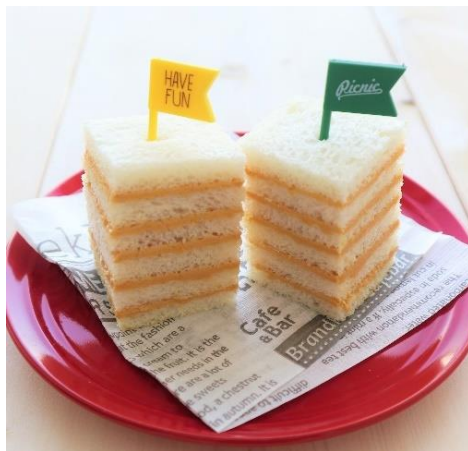
ピーナッツのアレンジレシピ 「ポーターサンドイッチ」