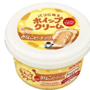
きなこピーナッツ