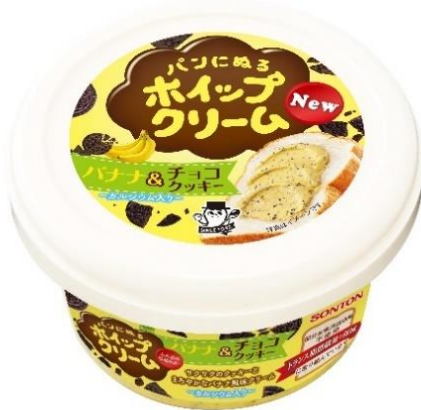
パンにぬるホイップクリーム バナナ&チョコクッキー

相性の良い人気のある味を、パンにぬるホイップクリームにしました。ミルクカルシウムを配合し、お子様にもピッタリな商品に仕上げました。