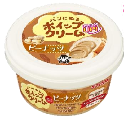
パンにぬるホイップクリーム ピーナッツ 新デザイン