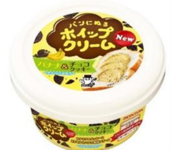
バナナ&チョコクッキー

ソントン株式会社ホームページ URL: http://www.sonton.co.jp/