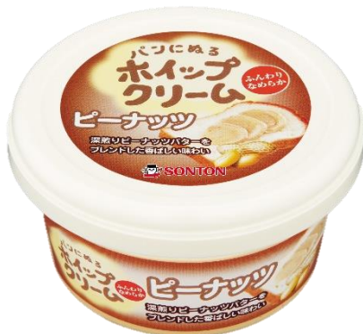
パンにぬるホイップクリーム ピーナッツ 旧デザイン

甘さの中に塩味のある引き締まった味わいになりました。パンの甘味ともマッチし、ピーナッツの味わいをよりお楽しみ頂けます。