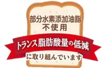
部分水素添加油脂不使用ロゴ

パンにぬるホイップクリームシリーズは、トランス脂肪酸を多く含む部分水素添加油脂不使用のほどを、製品の側面ラベルに記載し、安心を訴求します。