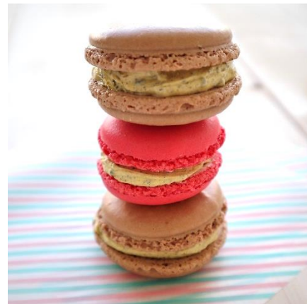
バナナ&チョコクッキーのアレンジレシピ 「カラフル!バナナマカロン」