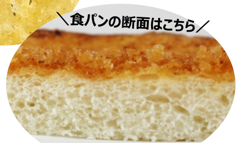
食パンの断面はこちら/ ※コンソメ風味使用