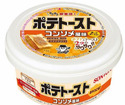
ポテトースト コンソメ風味

ポテトーストは、子供から大人まで多くの人が食べたことのある、お菓子のコンソメ味・コンポタ（コーンポタージュ）味を再現しました。塗って焼くだけで子供が喜ぶ調理パンが作れるので、忙しい朝の食事やおやつにオススメです。