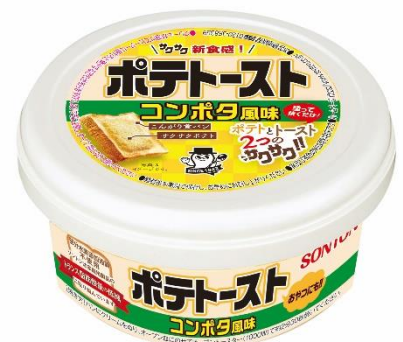
ポテトースト コンポタ風味