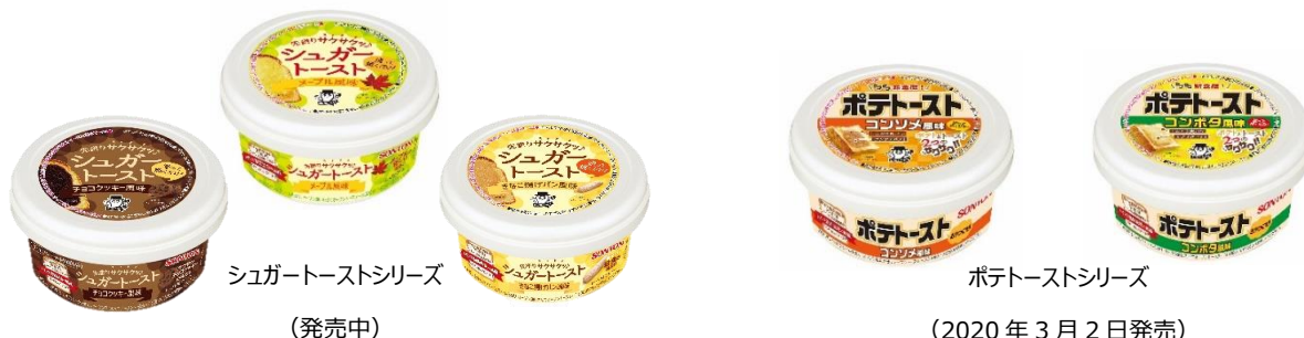
シュガートーストシリーズ (発売中)

塩味系トーストを食べたい方には新商品「ポテトースト」がオススメです。コンソメ風味、コンボタ風味の2フレーバーをラインナップしており、子供から大人まで多くの方が一度は食べたことのあるお菓子の味わいをトーストでもお楽しみいただけます。