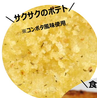
サクサクのポテト/ ※コンポタ風味使用