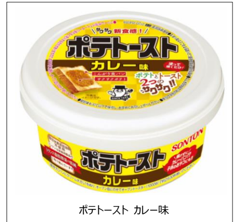
ポテトースト カレー味

新発売の「ポテトースト カレー味」は、塗って焼くだけで、まるで揚げたてのカレーパンのようなサクサク食感を楽しめます。サクサクの正体は、なんと“ポテト”です！いつもの朝食が変わる、まさにトースト革命！！簡単に作れるので、忙しい朝の食事やおやつにオススメです。