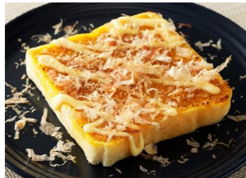
＜ポテトースト カレー味+かつお節マヨ＞ 和風なカレー味にアレンジ