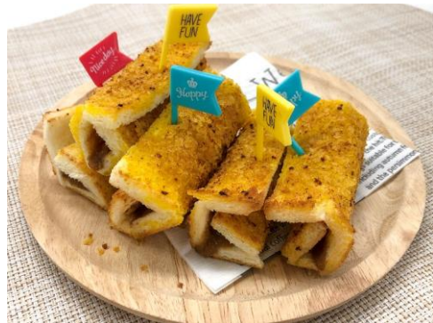
ポテトーストで、外はサクサク、中はとろっと。まさにカレーパン！