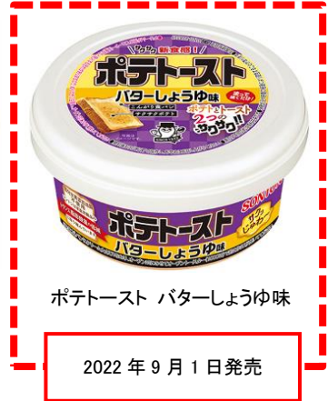
ポテトースト バターしょうゆ味