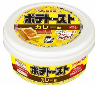
ポテトースト カレー味