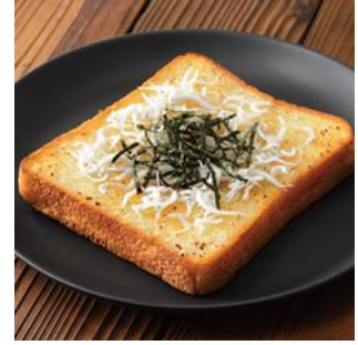
バターしょうゆ味×しらすと海苔 和風トースト

ポテトーストの様々なアレンジレシピは、ポテトーストのブランドサイトをはじめ、ソントンのホームページや公式インスタグラムでも配信中です。ぜひご覧ください。