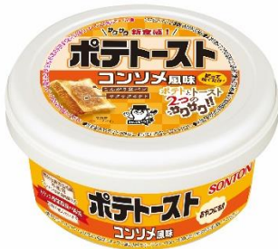
ポテトースト コンソメ風味

いつもの朝食が変わる、まさにトースト革命！新しいパンのお供『ポテトースト』を、この機会にぜひ召し上がってみてください。