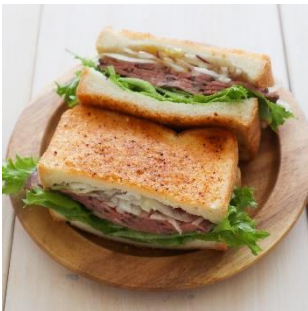
コンソメ風味×ローストビーフ ボリュームーなサンドイッチ