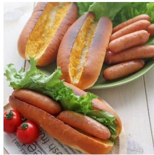
カレー味×ホットドッグ 子供も大満足