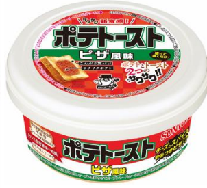
ポテトースト ピザ風味