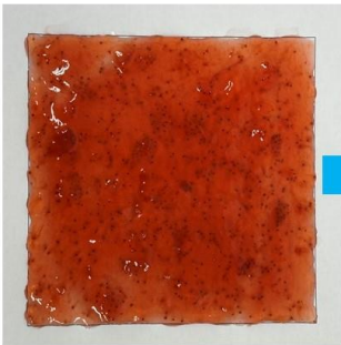
これまでのファミリーカップ イチゴジャム

果実感アップ でソントン紙カップ史上最高の満足感！「低糖度 45 度」で 甘さすっきり ！