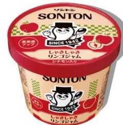
しゃきしゃきリンゴジャム