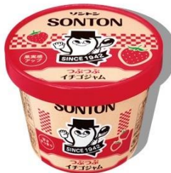
つぶつぶイチゴジャム