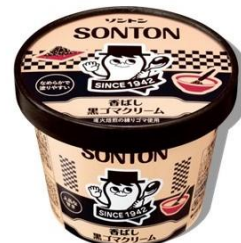
香ばし黒ゴマクリーム