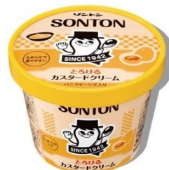
とろけるカスタードクリーム