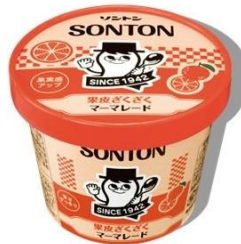
果皮ざくざくマーマレード