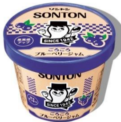
ごろごろブルーベリージャム