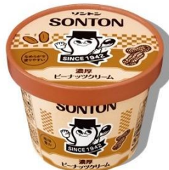
濃厚ピーナツクリーム