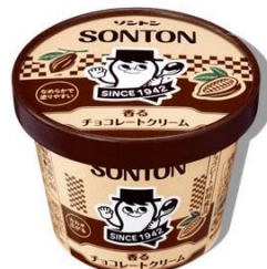
香るチョコレートクリーム